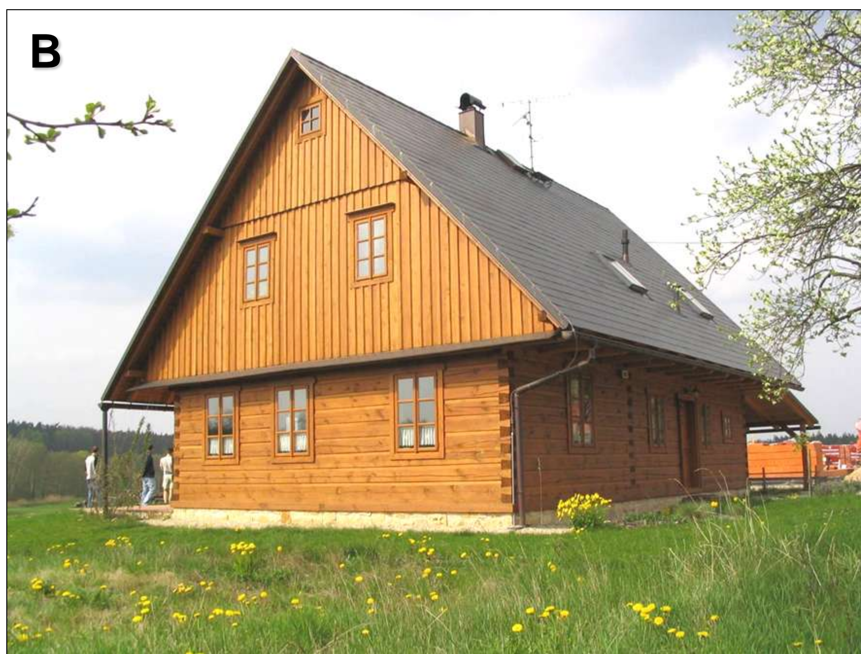
Foto B:

Ideálním případem je, když se stavitel nechá inspirovat původní architekturou, která je obvyklá v daném regionu. Vůbec nic to neubírá možnosti moderního způsobu bydlení. Na snímku B je novostavba roubeného rodinného domu v obci Býšť-Bělečko ve východních Čechách, jejíž inspirací je tradiční východočeský roubený dům – je dodržen tvar a sklon střechy, obdélníkový půdorys stavby a také rozmístění oken ve štítové stěně – ve východních Čechách jsou typická dvě až tři okna ve štítové stěně. Rovněž klasická šesti-tabulková okna postavená na výšku jsou zdejšími znaky – u novostavby jsou již oproti původním stavbám zvětšena, aby byla splněna současná norma pro osvětlení – tato úprava směrem k dodržení současných předpisů však výsledný dojem nesnižuje. Na fotografii A je zachycen původní roubený domek stojící přímo přes ulici naproti novostavbě.